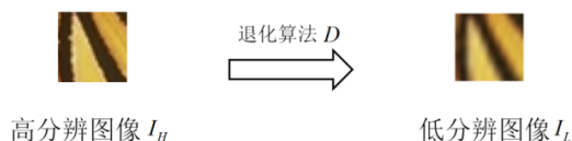
图 2-2 示例图片 2