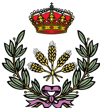
Figura A.1. Logo de la ETSIAAB utilizado en la cubierta trasera de la memoria

La ETSIAAB tiene configurados como colores principal y de link el RGB (99, 178, 76). El logo es el mostrado la figura A.1.