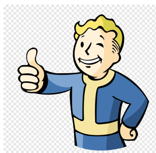
Figura 3.1. Vault Boy approves that

En definitiva, la imagen (figura 3.1) se mostrará con un ancho igual al 25% del ancho que ocupa el texto, centrada, con un pie de foto y una etiqueta para referenciar.