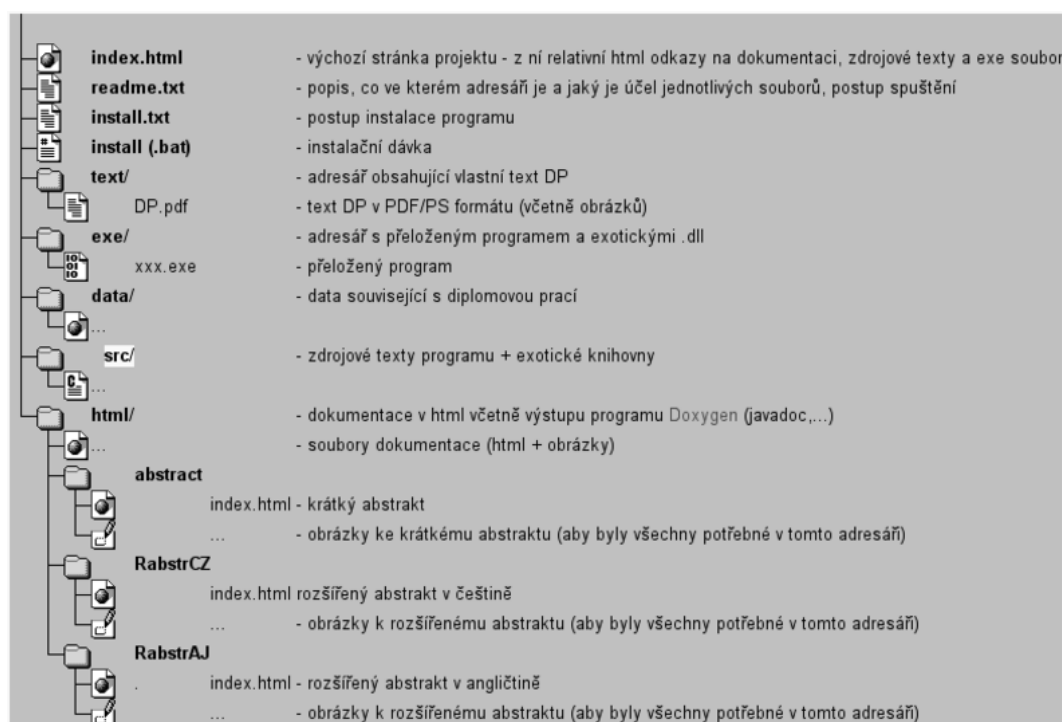
Obrázek F.1: Seznam přiloženého CD — příklad

Může vypadat například takto. Váš seznam samozřejmě bude odpovídat typu vaší práce. (viz [5]):