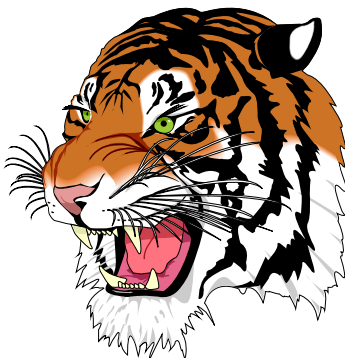
FIGURE 2.1 – Une figure avec une légende assez longue qui peut même, au besoin, s'étaler sur plusieurs lignes.